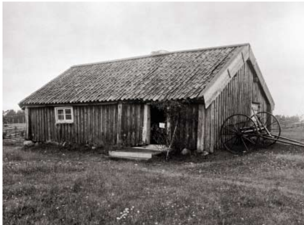
Fiskarböndernas boningshus liknade fastlandsböndernas. Denna stuga är från Nättarö, 1924.

underlag att bygga på i ett skyddat läge var också nödvändigt och sist men inte minst måste man förstås ha tillgång till färskvatten. Just färskvattnet var kanske den främsta anledningen till att nästan inga nya öar bebyggdes efter 1500-talet fram till dess att en utvecklad brunnsborrningsteknik under 1900-talet öppnade möjligheterna att bygga nästan var som helst.