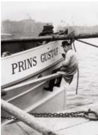
"Prins Gustaf" var ett av de fartyg som 1901 bildade stommen i det nya bolaget Waxholms Nya Ångfartygs Aktiebolag.