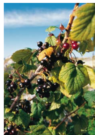
Svarta vinbär, tistron